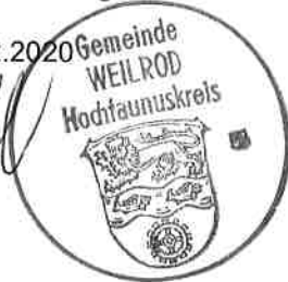
Götz Esser Bürgermeister