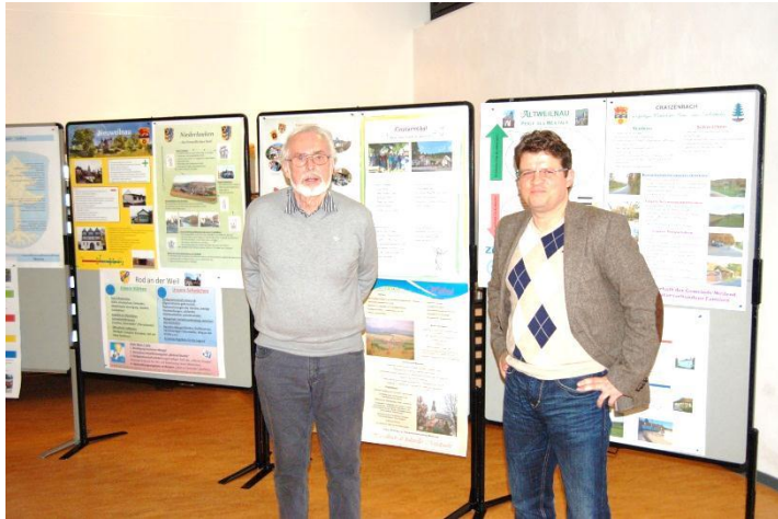
1. IKEK-FORUM AM 04.12.2015