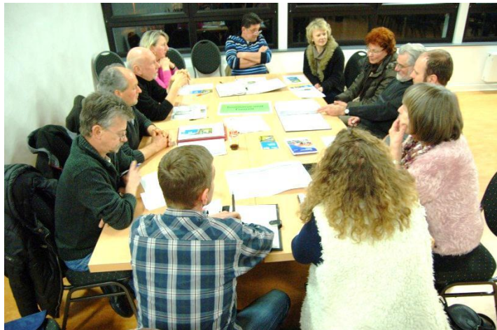
2. IKEK-FORUM AM 10.02.2015