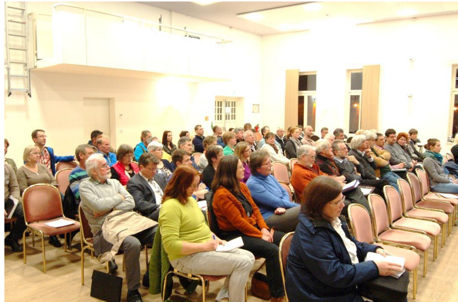
3. IKEK-FORUM AM 17.03.2015